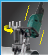
送りハンドル モーターの振動が少ない切断作業が可能。